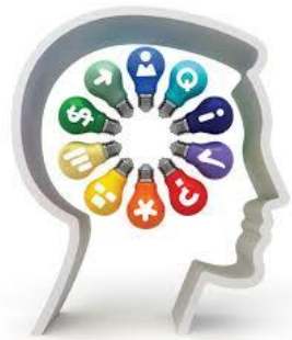
Fig. 1. Conocimiento, motor del desarrollo. [3]