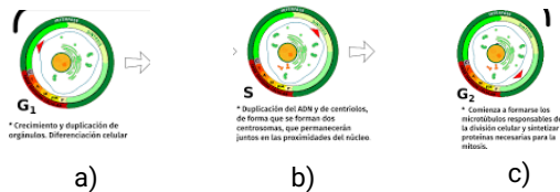
Fig. 2. (a), (b) y (c) Ciclo celular donde se muestra la interfase más larga, la célula crece y copia su ADN antes de pasar a la mitosis y cuando los cromosomas se alinean, separan y mueven hacia nuevas células hijas. [2]