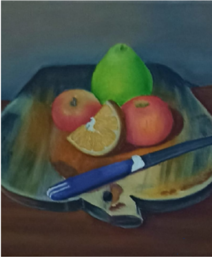
Autora: Xiomara Reyes Título de la obra: "Frutas en tabla de picar" Técnica: Óleo sobre lienzo Formato: 30x40 cm