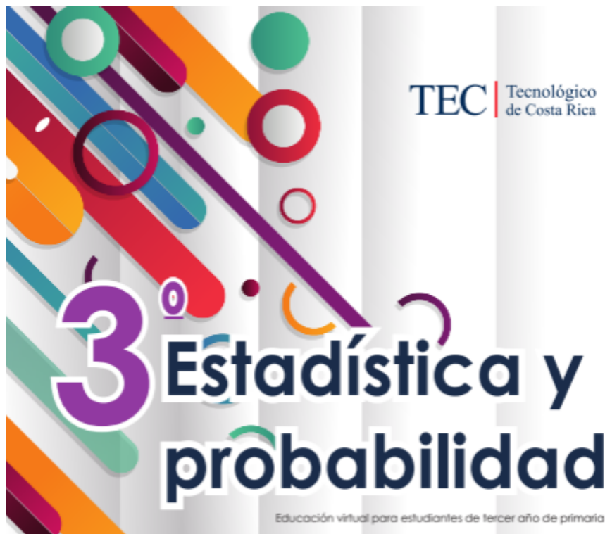
Portada del libro: Probabilidad y Estadística.