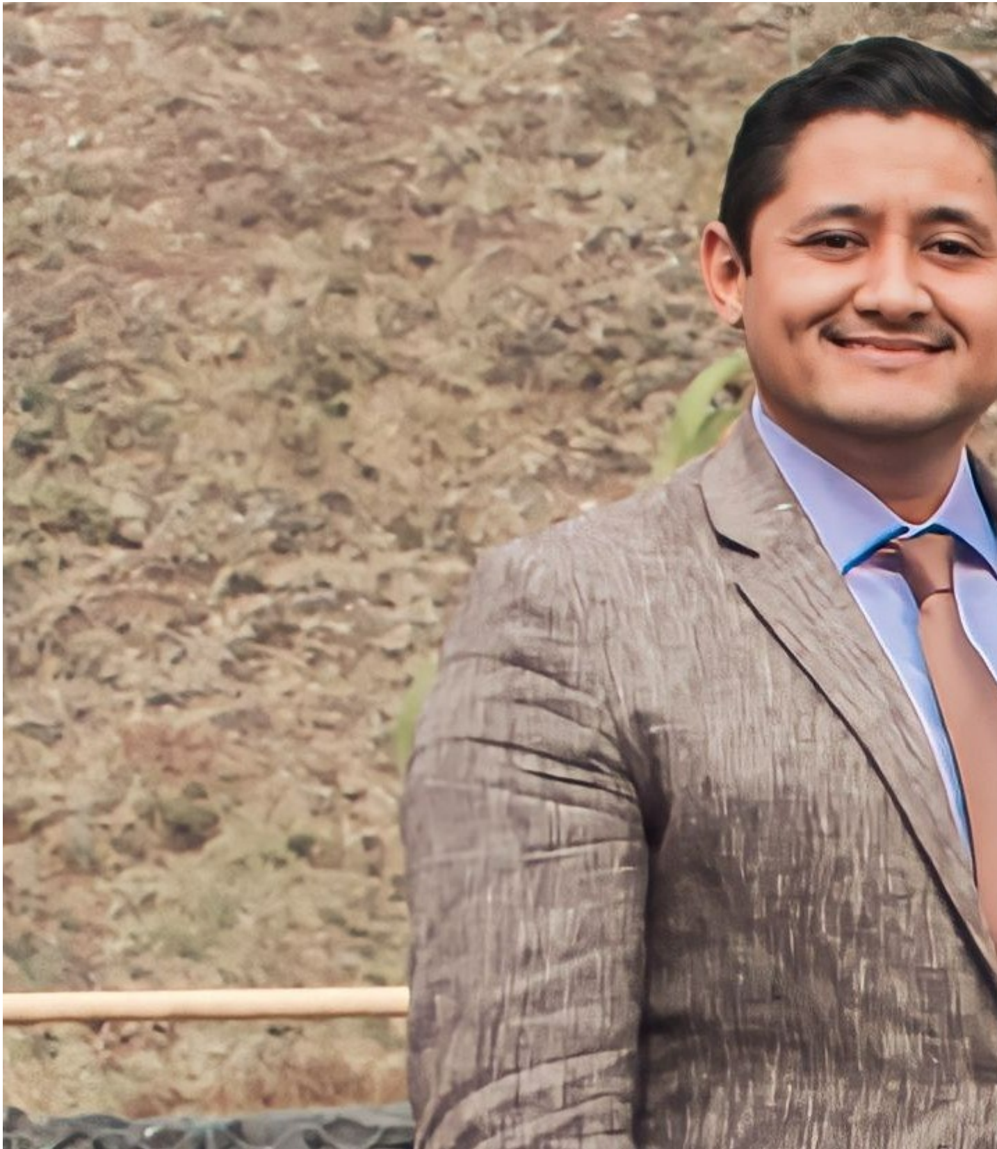
El doctor Alexei Carrillo, ministro de Salud a.i.