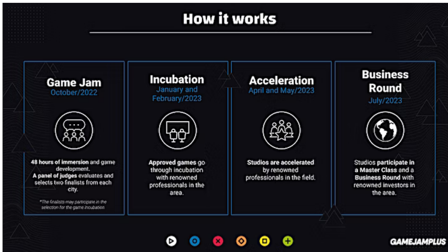
Etapas del GameJam+ 2022-2023.

Este proceso tiene una duración de aproximadamente 8 meses y la primera de ellas -el prototipado- fue la que se desarrolló el pasado fin de semana en el CETT.