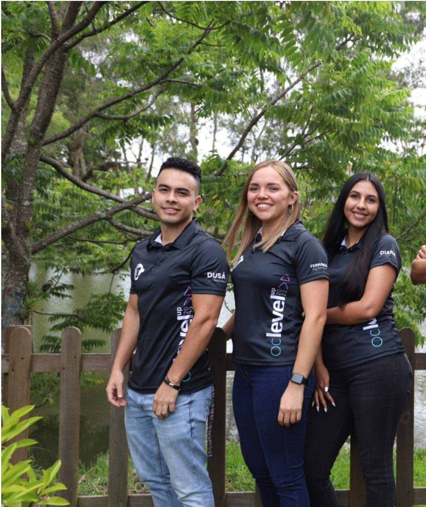
Integrantes del grupo NextLevel que obtuvo el segundo lugar de Level up y un premio