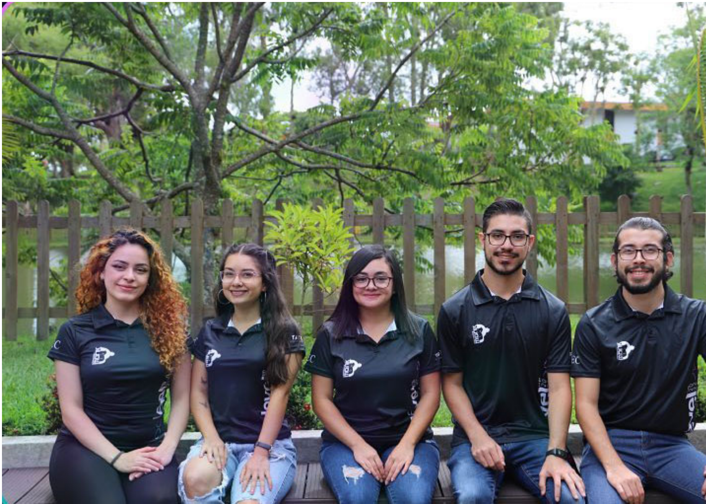
Grupo MindBlowers, ganadores del tercer lugar y un premio de $1.000. Fotografía

La iniciativa desarrollada por los jóvenes de MindBlowers se enfocó en la creación de una app que permita agilizar muchos de los procesos que tienen que realizar las navegadoras durante su apoyo a los pacientes , como recolección de datos, llenado de formularios, asignación de tareas e inclusive la identificación de barreras en el proceso que buscan de forma integral dar un apoyo a estas personas.