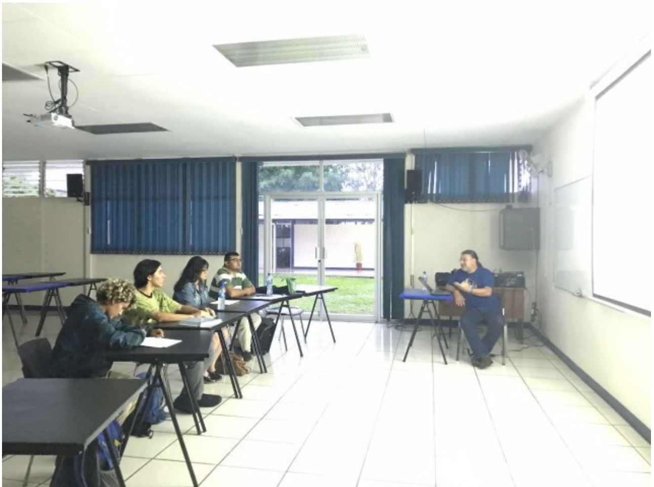
El taller literario también ha desarrollado una modalidad itinerante. La fotografía corresponde a una sesión de trabajo en la Sede del Atlántico de la Universidad de Costa Rica.