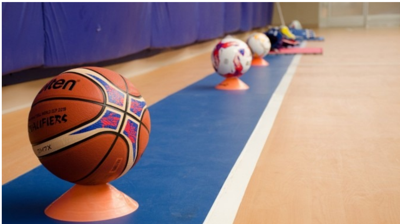
Imagen con fines ilustrativos.