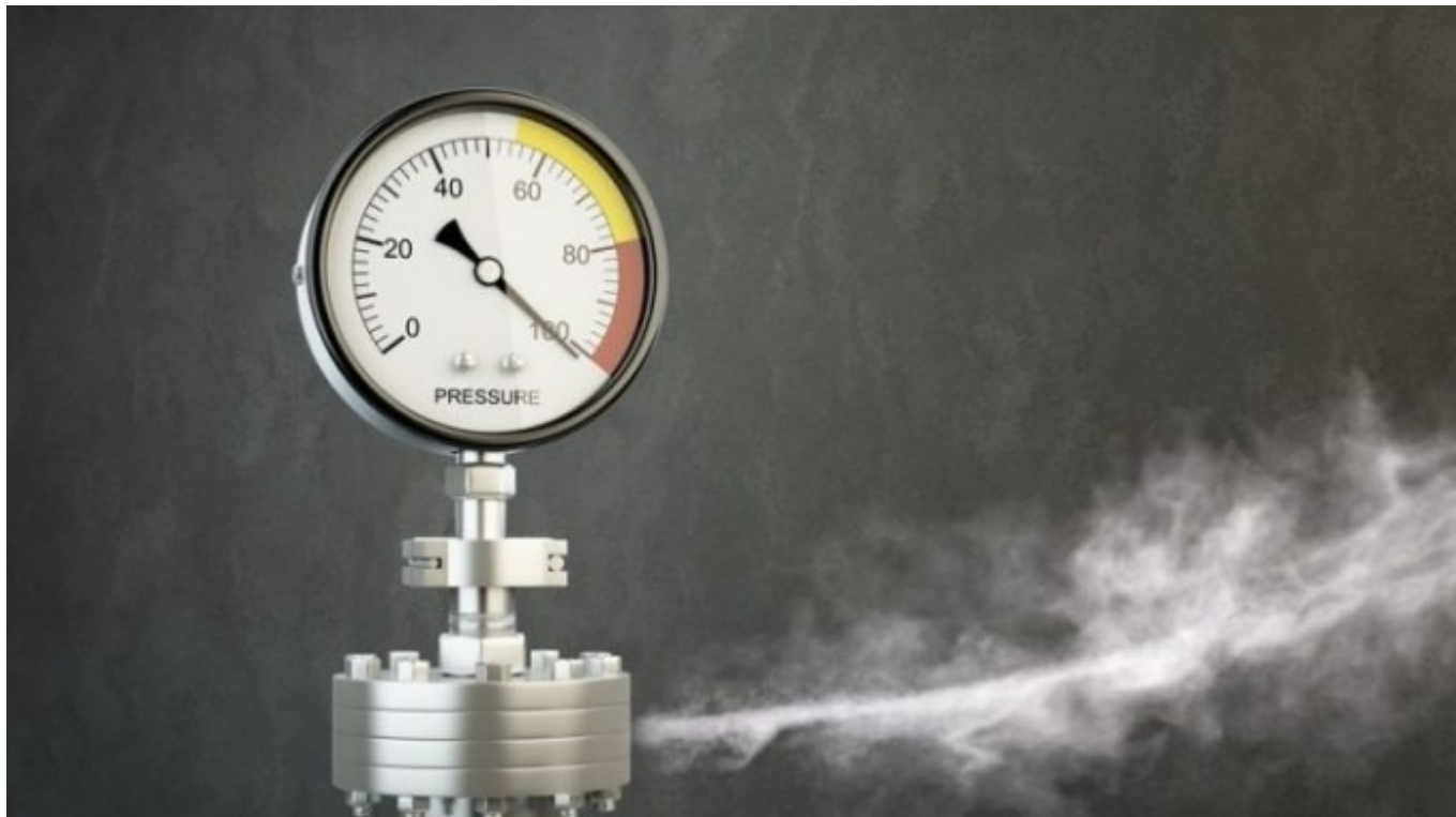
Imagen con fines ilustrativos

Un caso de estudio que puede ayudarte a sobrellevar la pandemia