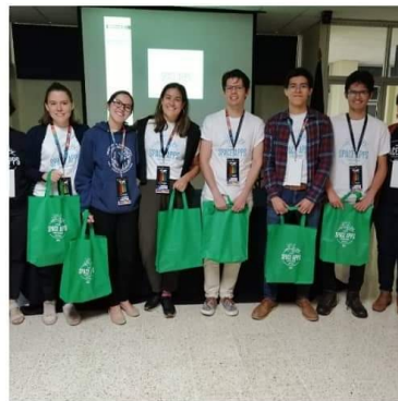
Ganadores del del NASA International Space Apps Challenge 2019.

El International Space Apps Challenge es una competencia mundial organizada por el Programa de Incubación de la Innovación de la Administración Nacional de la Aeronáutica y del Espacio (NASA, en inglés) [4].