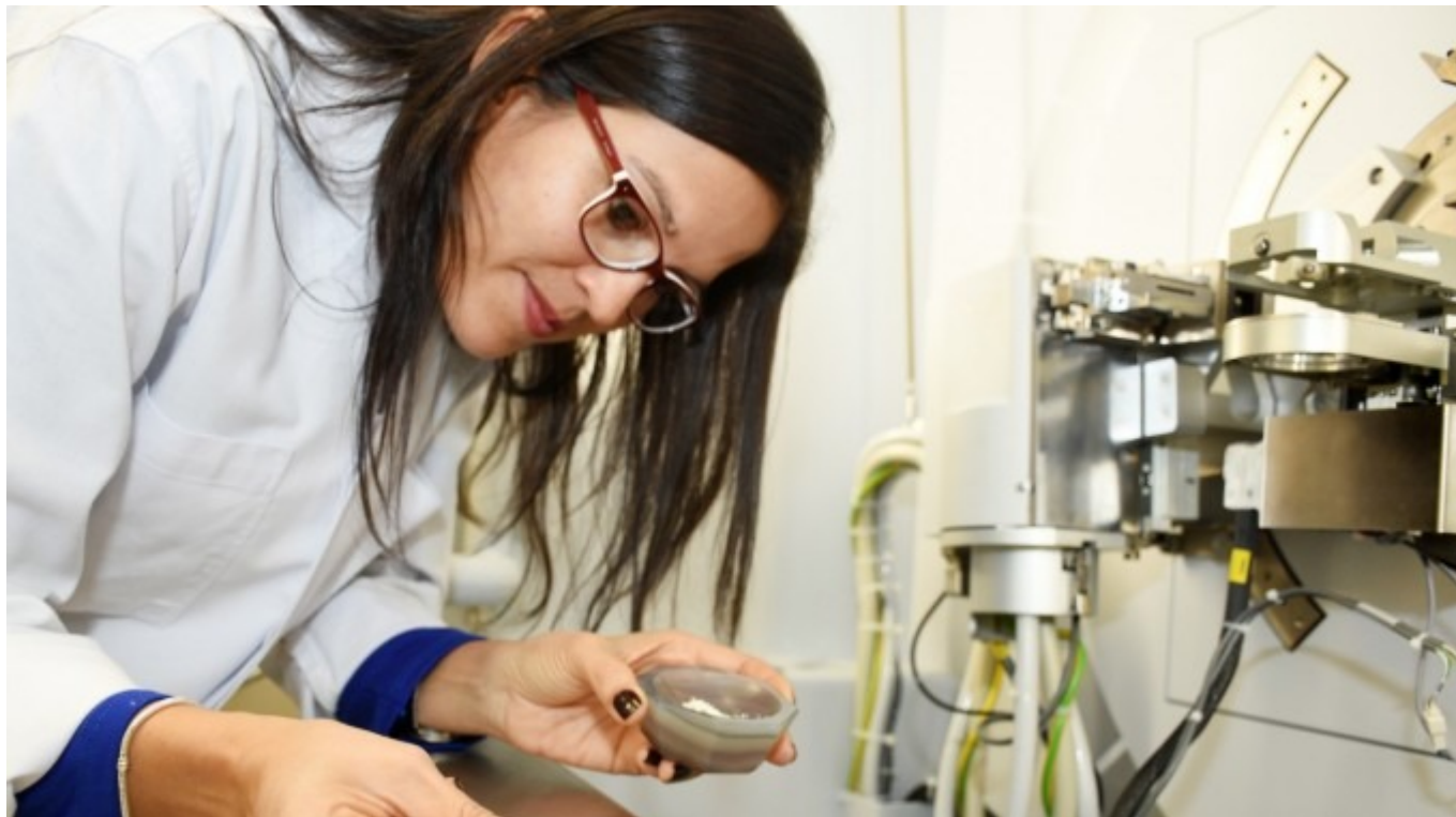
Imagen con fines ilustrativos, en uno de los laboratorios de la Escuela de Ciencia e Ingeniería de los Materiales.