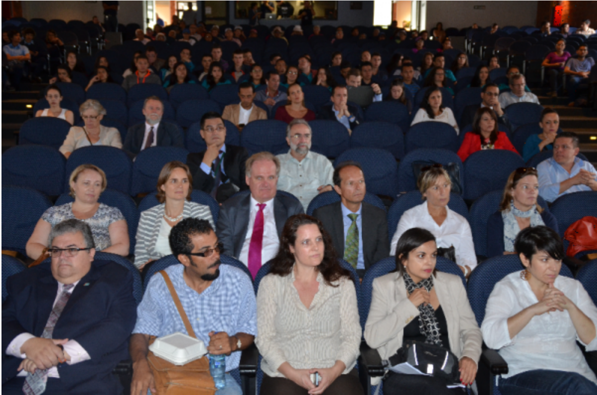
Expertos y asistentes en la mesa redonda "Ciudadanía, Gobiernos Locales y Movilización Urbana".

Source URL (modified on 04/10/2018 - 08:57): https://www.tec.ac.cr/hoyeneltec/node/283