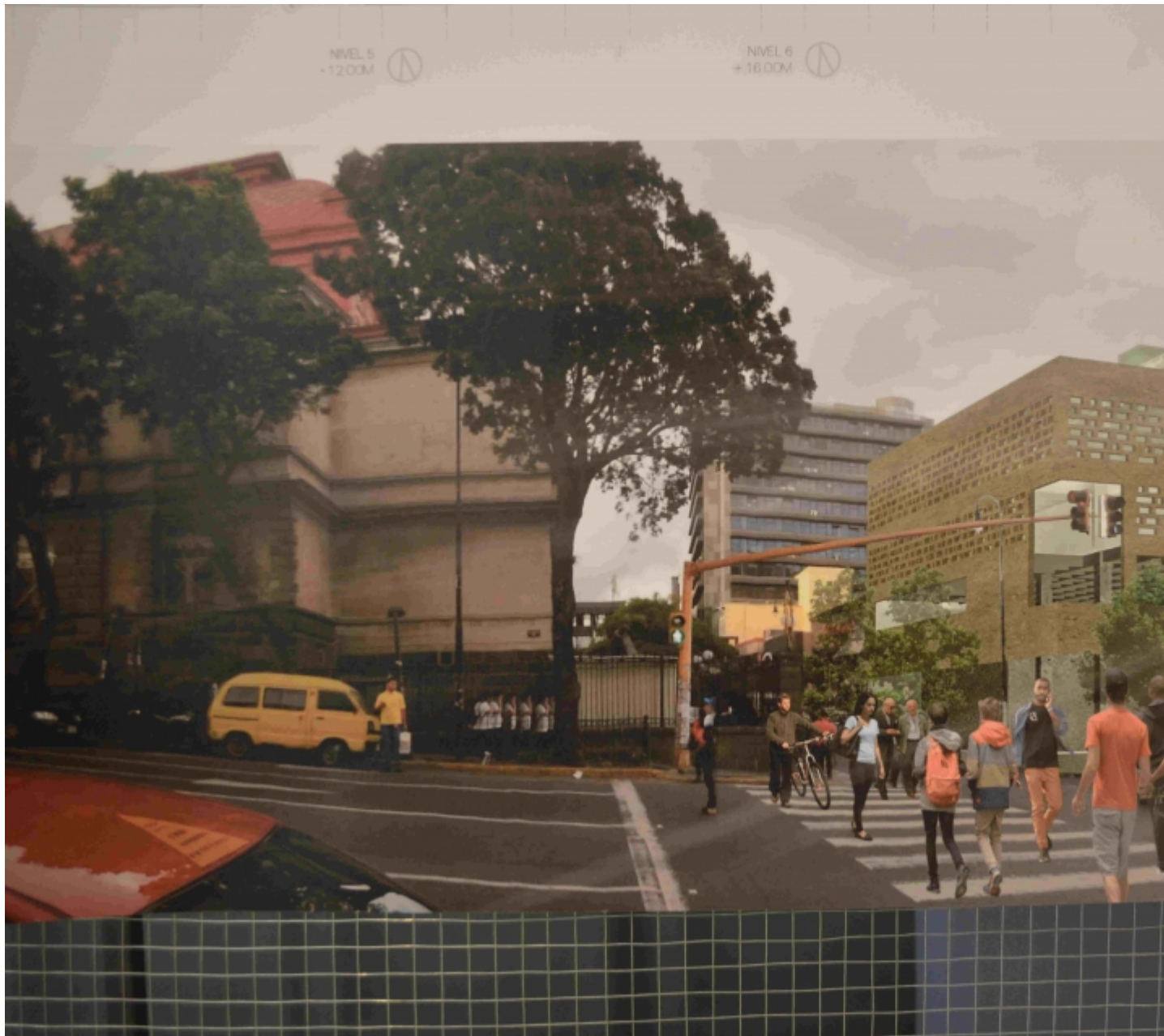
Vista del edificio propuesto desde su costado sur, sobre la avenida segunda.

Vea aquí la noticia de la premiación que realizó el Teatro Nacional [6]